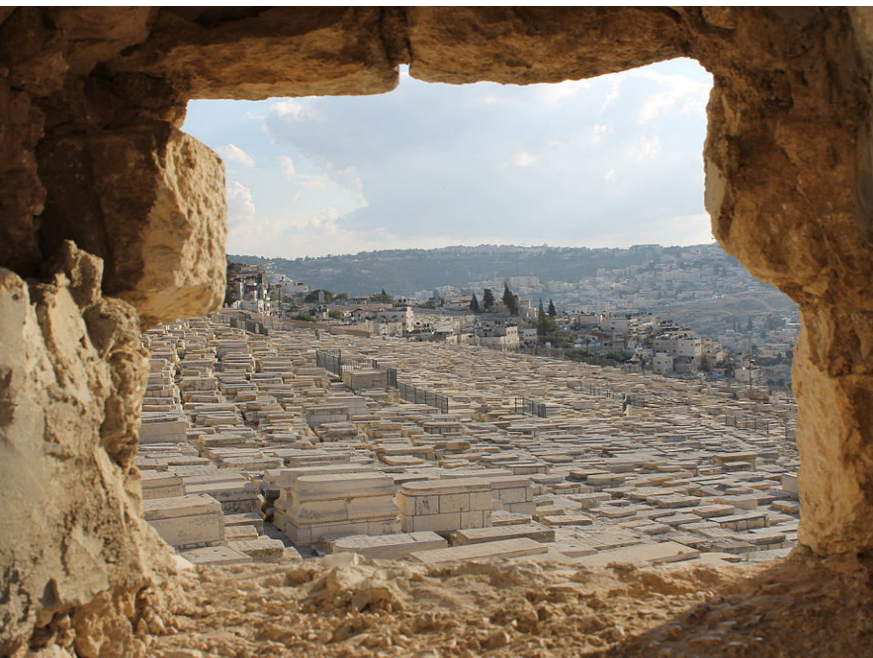
Cmentarz żydowski na Górze Oliwnej

krainie cieni. Dzięki biżuterii zmarły miał zyskać przychylność wyższych mocy, z którymi przyjdzie się mu spotkać. Zdarzało się, że na zamknięte oczy zmarłego kładziono skorupki rozbitego naczynia. Zwyczaj ten zakorzeniony jest w słowach Talmudu: „[...] każdy człowiek ma za życia zawiść w oczach, wzrokiem zazdrości i pożąda. Nic, nawet po śmierci, nie jest w stanie uspokoić oczu. Trzeba zaś, by zmarły wyzbył się doczesnych pragnień, a tylko wtedy kończą się nasze pragnienia, gdy zakryje się oczy” ( Taanit 32).