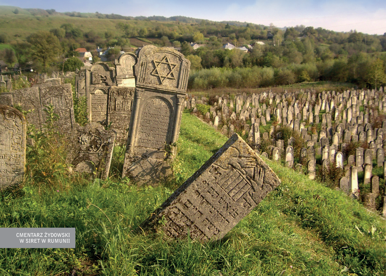
CMENTARZ ŻYDOWSKI W SIRET W RUMUNII

Zwyczaje pogrzebowe w Palestynie czasów Jezusa