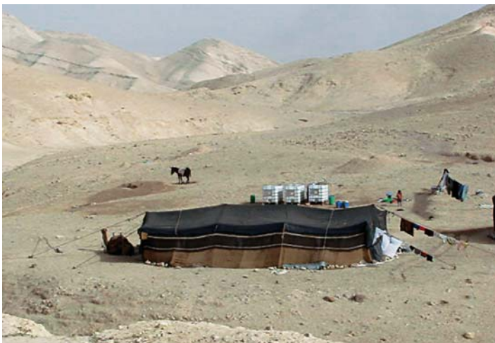
Osada beduińska na Pustyni Judzkiej