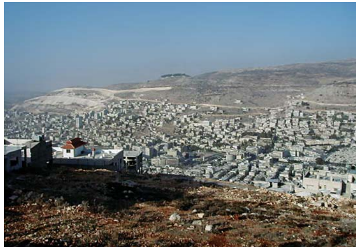
Panorama z góry Garizim w Samarii