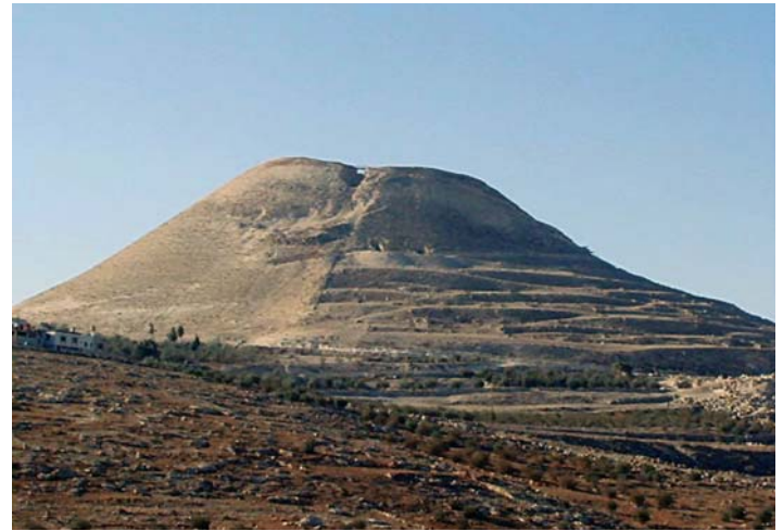
Herodion, forteca Heroda Wielkiego