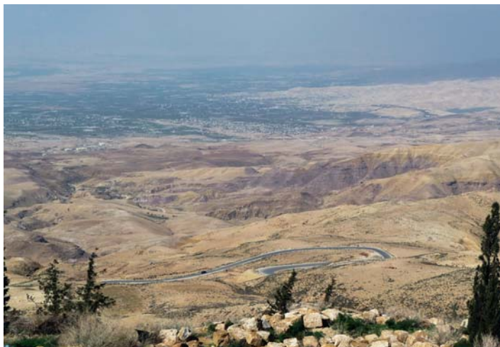
Widok rozciągający się z góry Nebo