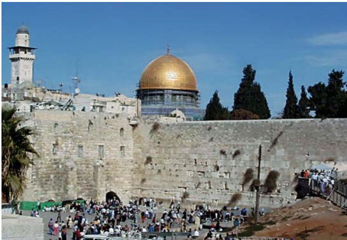
Mur Płaczu, jedyna pozostałość Świątyni. W tle meczet Kopuła Skały