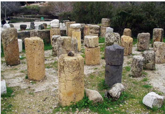
Pozostałości pogańskiego miasta Paneas (dziś Banias) na północy Izraela