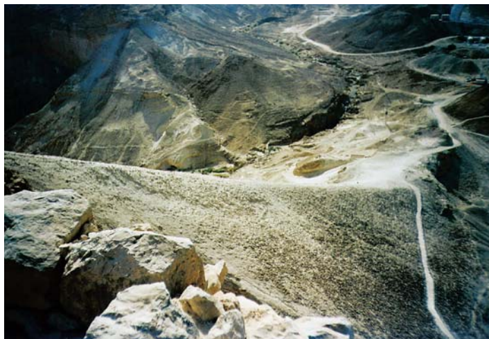
Rampa, którą przygotowali Rzymianie dla zdobycia Masady