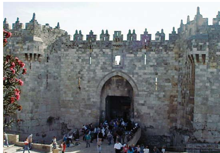
Brama Damascyńska w murach starego miasta w Jerozolimie