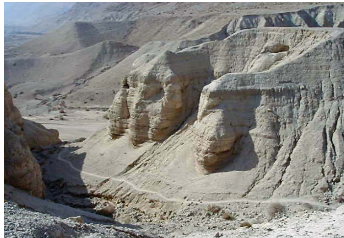
Pustynne skały w Qumran nad Morzem Martwym