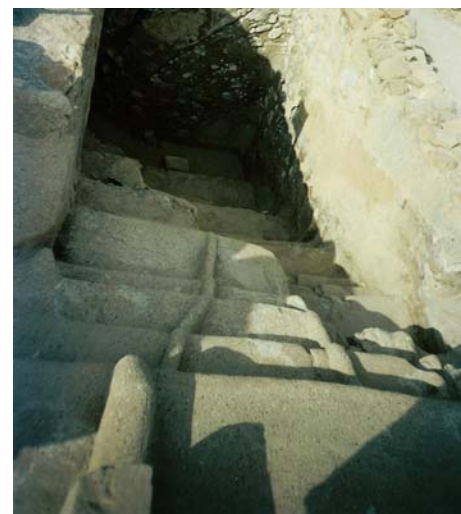
Qumran – schody prowadzące do basenu obmyć rytualnych