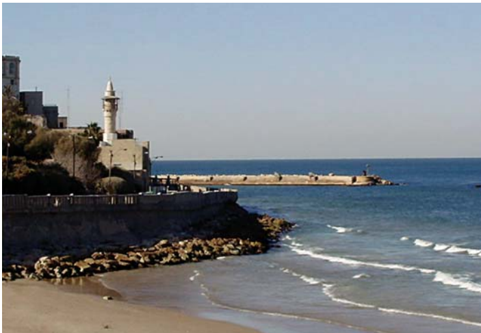
Port w Jafie