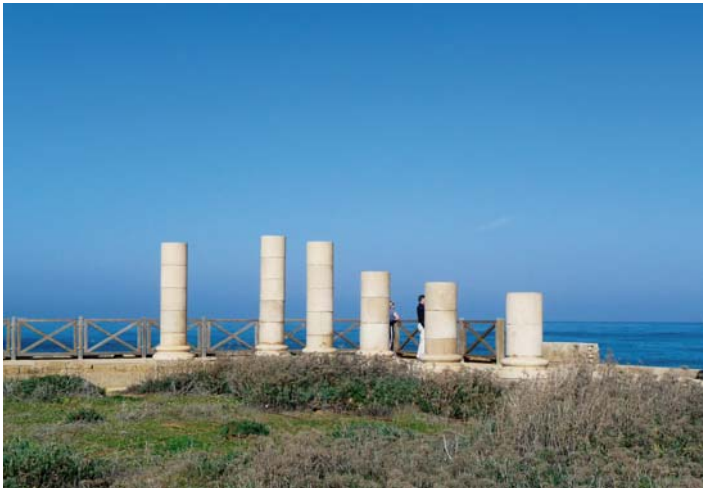
Cezarea nadmorska – ruiny pałacu Heroda