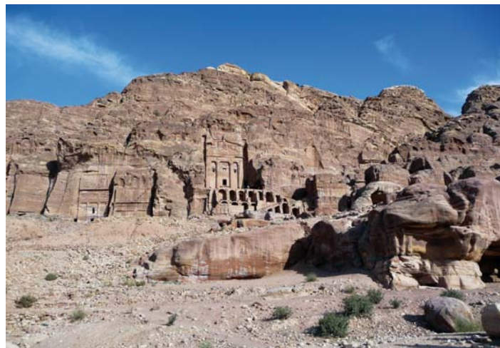
Petra, kraina Nabatejczyków