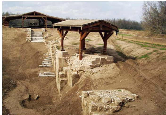
Betania na wschodnim brzegu Jordanu